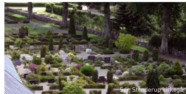
Sdr. Stenderup kirkegård

Hidtil har det været lidt tilfældigt, hvordan man har vurderet prissætningen af de enkelte ydelser. Og det